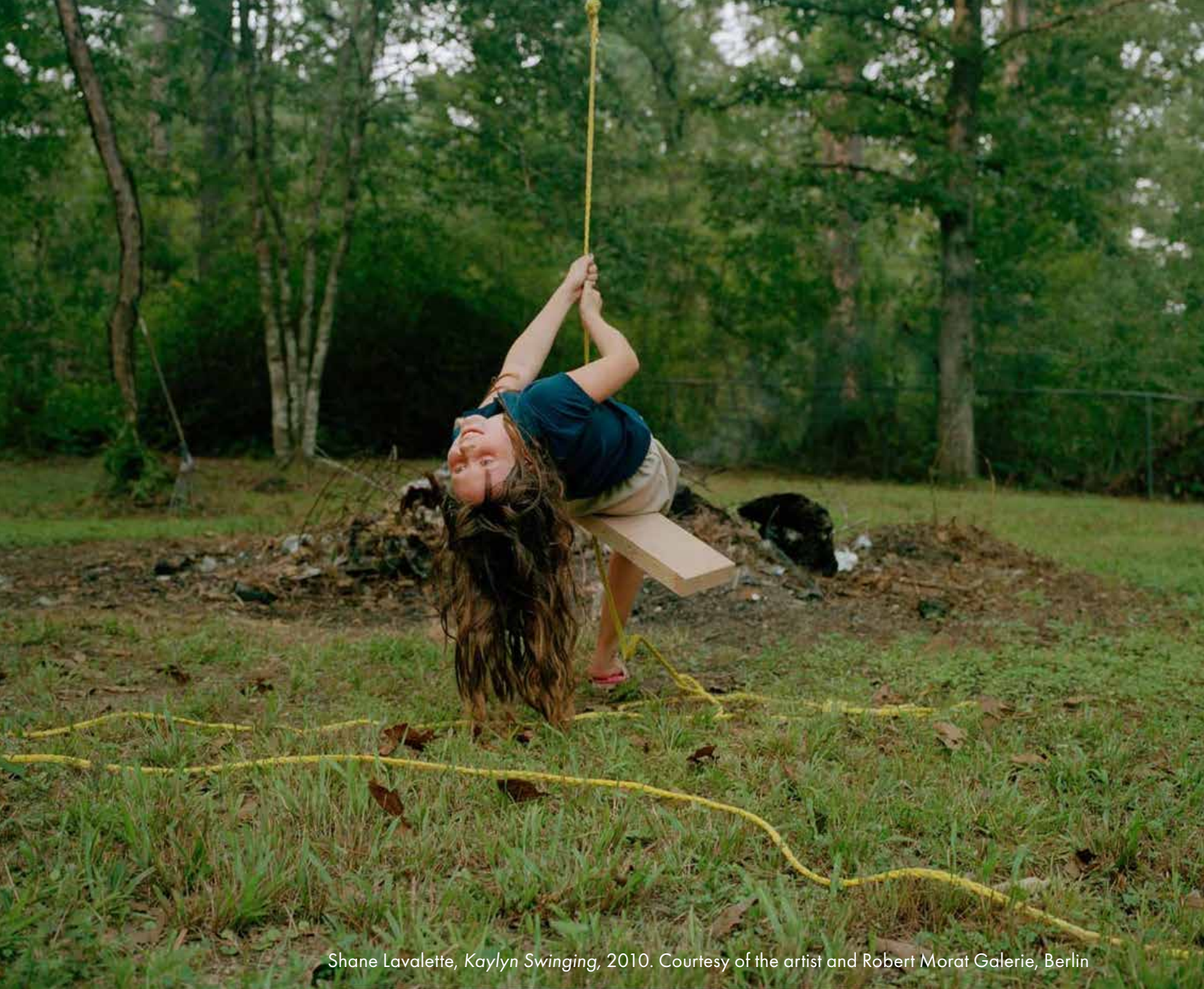
Shane Lavalette, Kaylyn Swinging , 2010.